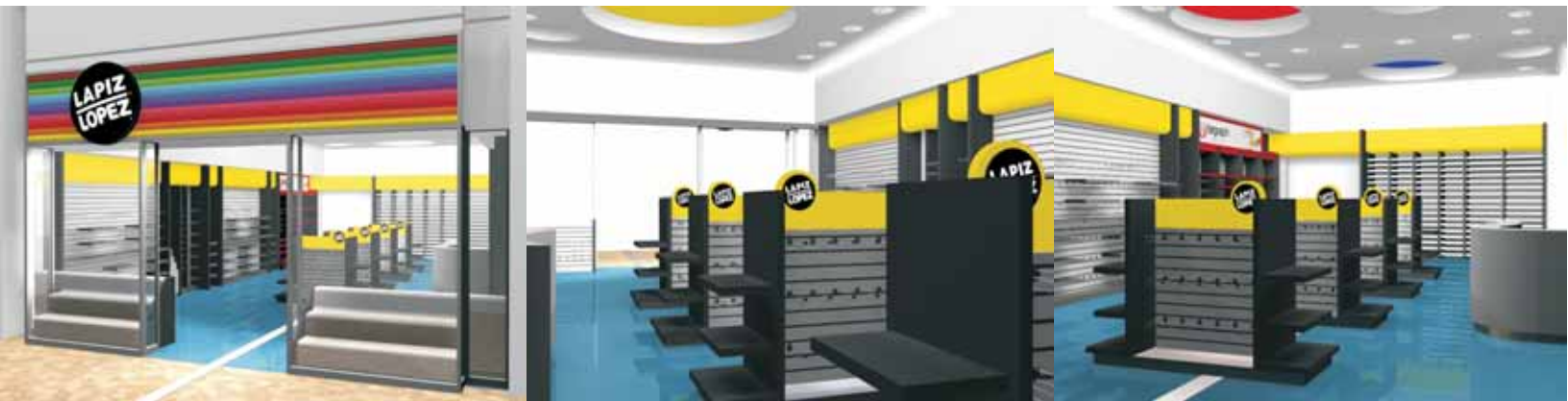
Nueva Imagen Lapis Lopez 2008, Proyecto Portal la Dehesa