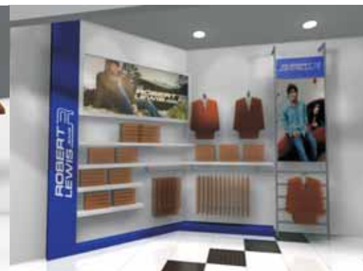
Traseras Ona Saez Sport, Traseras Latitude y Traseras Robert Lewis