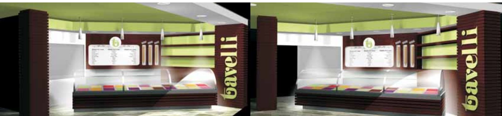
Nueva Imagen Tavelli 2008, Proyecto Portal La Dehesa.