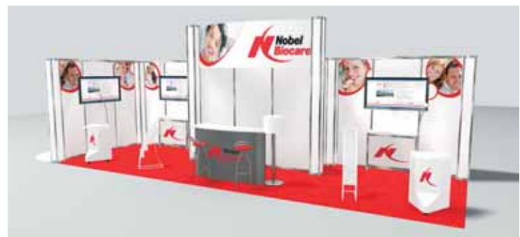
Stand Indalum, Stand Lan Courier y Stand Nobel Biocare