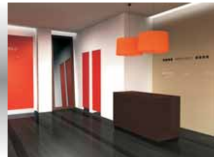
Stands Falabella Novios y Stand Wella