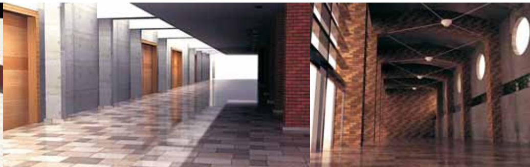
Modelado 3D, Espacio Riesco