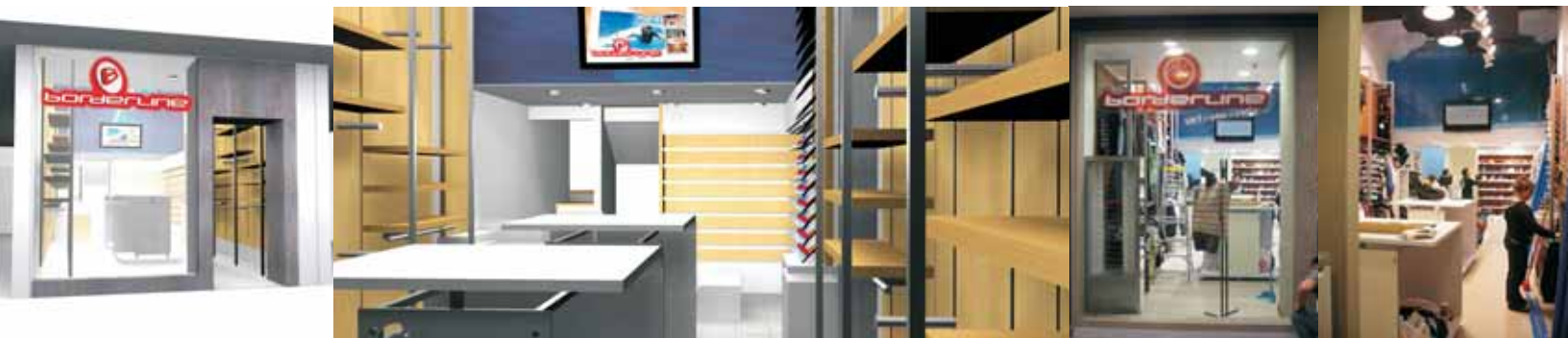
Tienda Borderline, Viña del Mar