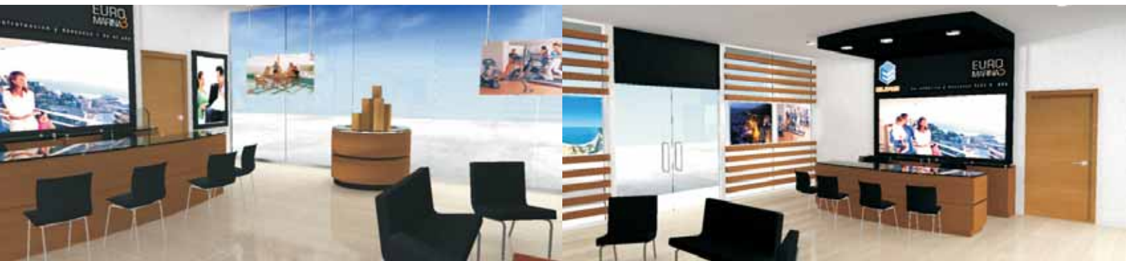
Sala de ventas EUROMARINA 3, Viña del Mar