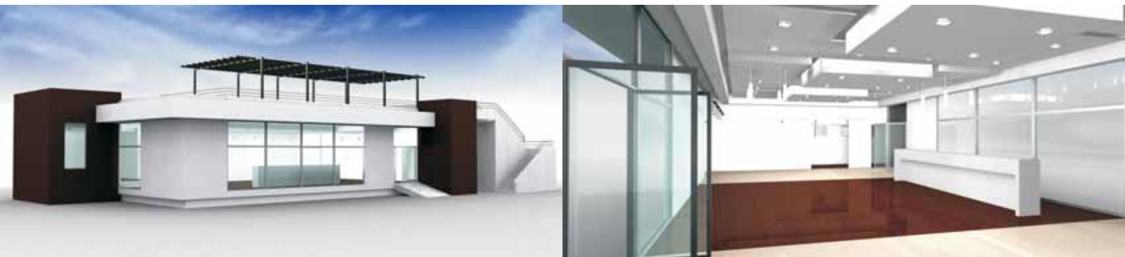
Modelado 3D, Sala de venta Brotec-Icafal EL Peñón